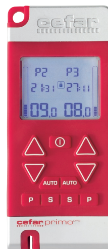
CEFAR PRIMO PRO